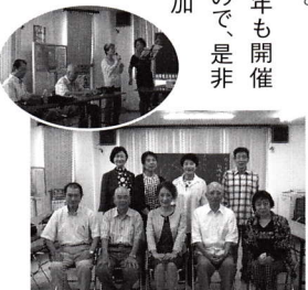
カラオケ参加者の皆さん